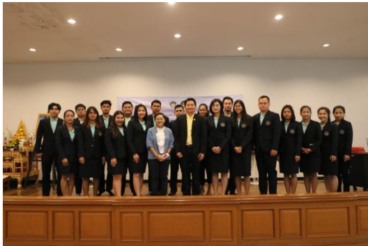
ภาพที่ 3 โครงการฝึกอบรมหัวข้อ “การพัฒนาหัวข้อและการเขียนเค้าโครงวิทยานิพนธ์”